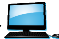
居（村）委会管理电脑